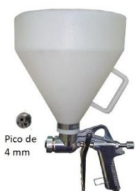
PISTOLA DE SALPICAR

Se necesita un compresor chico y la pistola de salpicar con un pico de 4 mm. La presión del aire se debe regular para que las partículas no reboten. La distancia debe ser intermedia, ni muy cerca ni muy lejos. Es muy fácil darse cuenta,